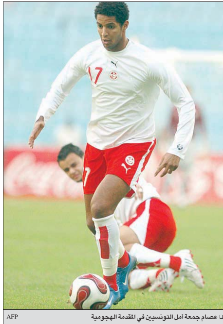
□ عصام جمعة أمل التونسيين في المقدمة الهجومية